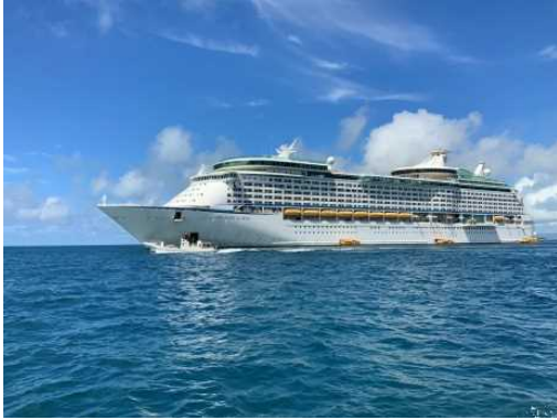
ボイジャー・オブ・ザ・シーズ

・ 7月29日、ロイヤル・カリビアン・インターナショナル社所属の「ボイジャー・オブ・ザ・シーズ（138,194GT）」が石垣港へ初寄港し、船内にて歓迎セレモニーが行われました。また、ユーグレナ石垣港離島ターミナルに上陸したクルーズ旅客等を、地元婦人会で構成する「パナパナ会」の歓迎アトラクションで出迎えました。このツアーは香港を出発し、那覇、石垣を巡る行程で、約3,840人の観光客が八重山の豊かな自然や文化を楽しみました。