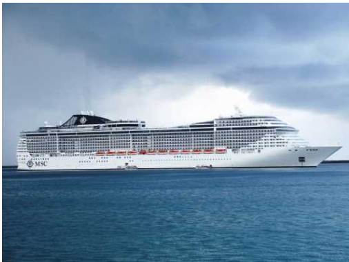
MSC スプレンドィダ（2018.8月平良港寄港時撮影）

・ 8月4日、MSCクルーズ社所属の「MSCスプレンドィダ（137,936GT）」が中城湾港へ初寄港しました。中国からの観光客を中心に約4,200人が訪れ、ツアーバスで美ら海水族館や首里城など、沖縄を代表する観光地を巡りました。船内では初寄港を歓迎するセレモニーが行われ、花束贈呈や記念品の交換が行われました。