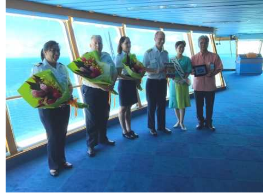
船内にて記念撮影

・ 8月4日、MSCクルーズ社所属の「MSCスプレンドィダ（137,936GT）」が中城湾港へ初寄港しました。中国からの観光客を中心に約4,200人が訪れ、ツアーバスで美ら海水族館や首里城など、沖縄を代表する観光地を巡りました。船内では初寄港を歓迎するセレモニーが行われ、花束贈呈や記念品の交換が行われました。