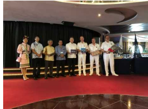
船内にて記念撮影

・ 8月15日、コスタ・クルーズ社所属の「コスタ・ベネチア（135,500GT）」が那覇港へ寄港し、船内で歓迎セレモニーが行われました。今年の3月に就航したばかりの同船は、上海を拠点にアジアクルーズを運航しており、今後は9月12日に中城湾港への初寄港も予定されています。