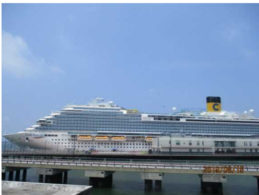
コスタ・ベネチア

・ 8月15日、コスタ・クルーズ社所属の「コスタ・ベネチア（135,500GT）」が那覇港へ寄港し、船内で歓迎セレモニーが行われました。今年の3月に就航したばかりの同船は、上海を拠点にアジアクルーズを運航しており、今後は9月12日に中城湾港への初寄港も予定されています。