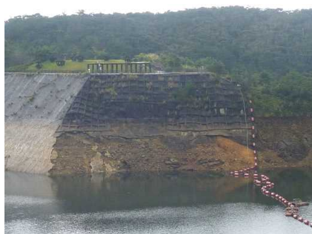
堤体右岸法面補修工事（安波ダム）