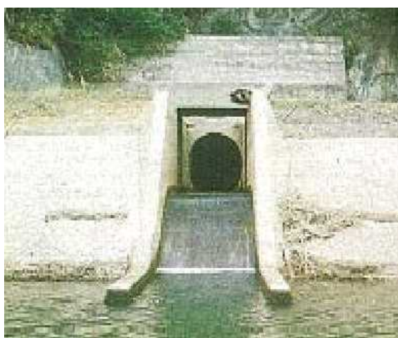
調整水路トンネル補修工事（福地ダム）