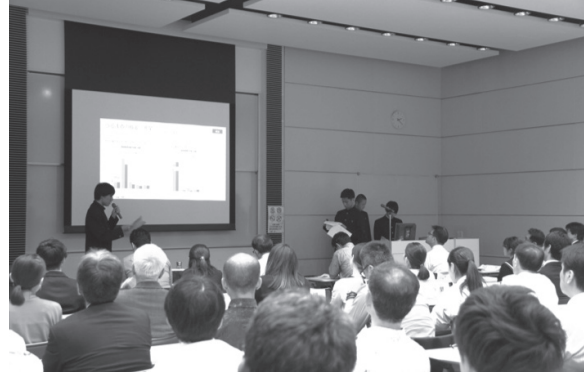
学生の発表の様子

各発表に対しては、有識者等から地域の課題解決への着眼点や分析手法等、学生の提案力の向上に繋がるアドバイスや今後に期待するコメントがありました。