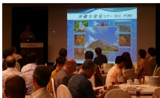
金融機関による「沖縄力発見ツアー」

沖縄のポテンシャルを実体験いただき、沖縄における知的・産業クラスター形成、沖縄への投資促進や新たな産業の創出・振興などを検討する契機とするため、県外の金融機関や製薬会社の方々に視察ツアーを行いました。