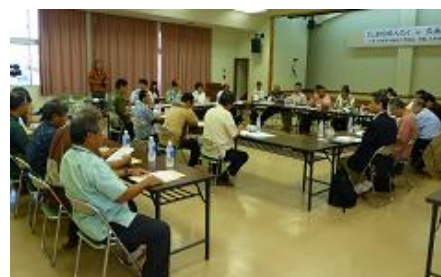
しまのゆんたく in 久米島