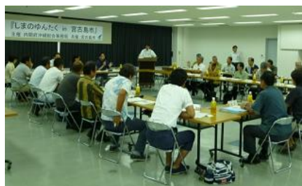
しまのゆんたく in 宮古島

離島内で頑張る方々と、島外の有識者等が、幅広くゆんたくし、新しい島興しのヒントを探るシンポジウムを開催しました。