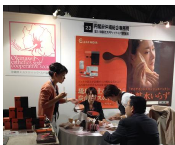
広域アライアンスマッチング in OKINAWA

「広域～」ではユニークな素材・製品・商品、技術を持つ企業等と大手小売業者等とのマッチングを行い、海外展開に向けた商品魅力の向上・高付加価値化を目指す場を提供し、「アフター～」では琉球スイーツと沖縄エステ・スパを商談会場では提供し、他地域商談会との差別化を図りました。