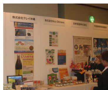
アフターコンベンション