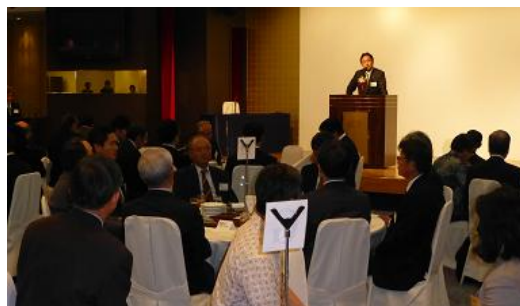
製薬会社による「沖縄力発見ツアー」