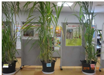
(さとうきび奨励品種の展示)