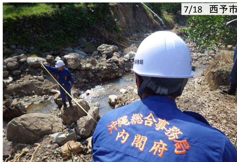
道路が崩落した範囲を計測・調査