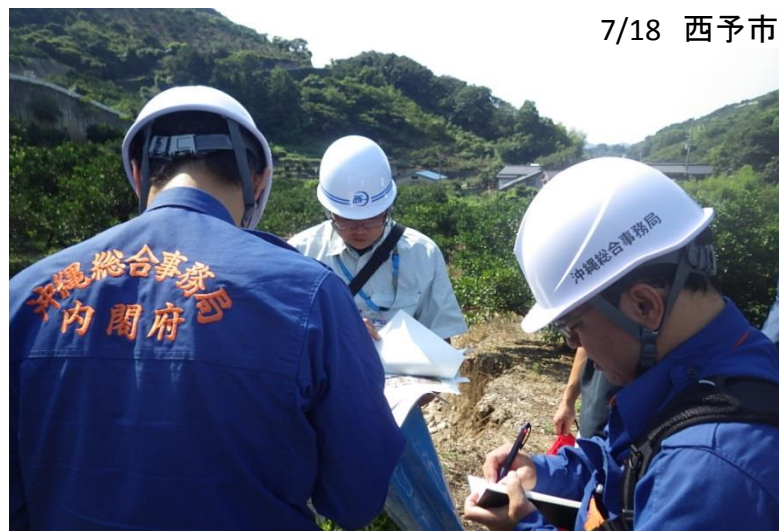
西予市の担当者と現地打合せ