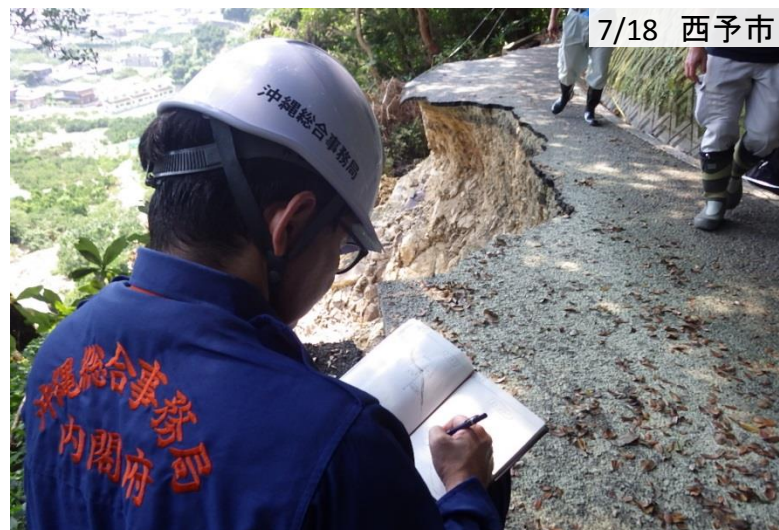
大雨によって崩落した道路を調査