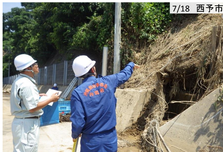
大雨によって崩壊した斜面を調査