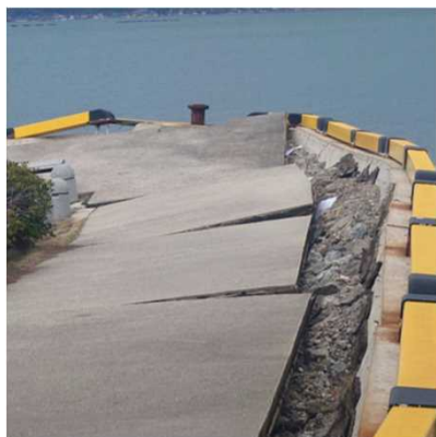
被災した港の岸壁