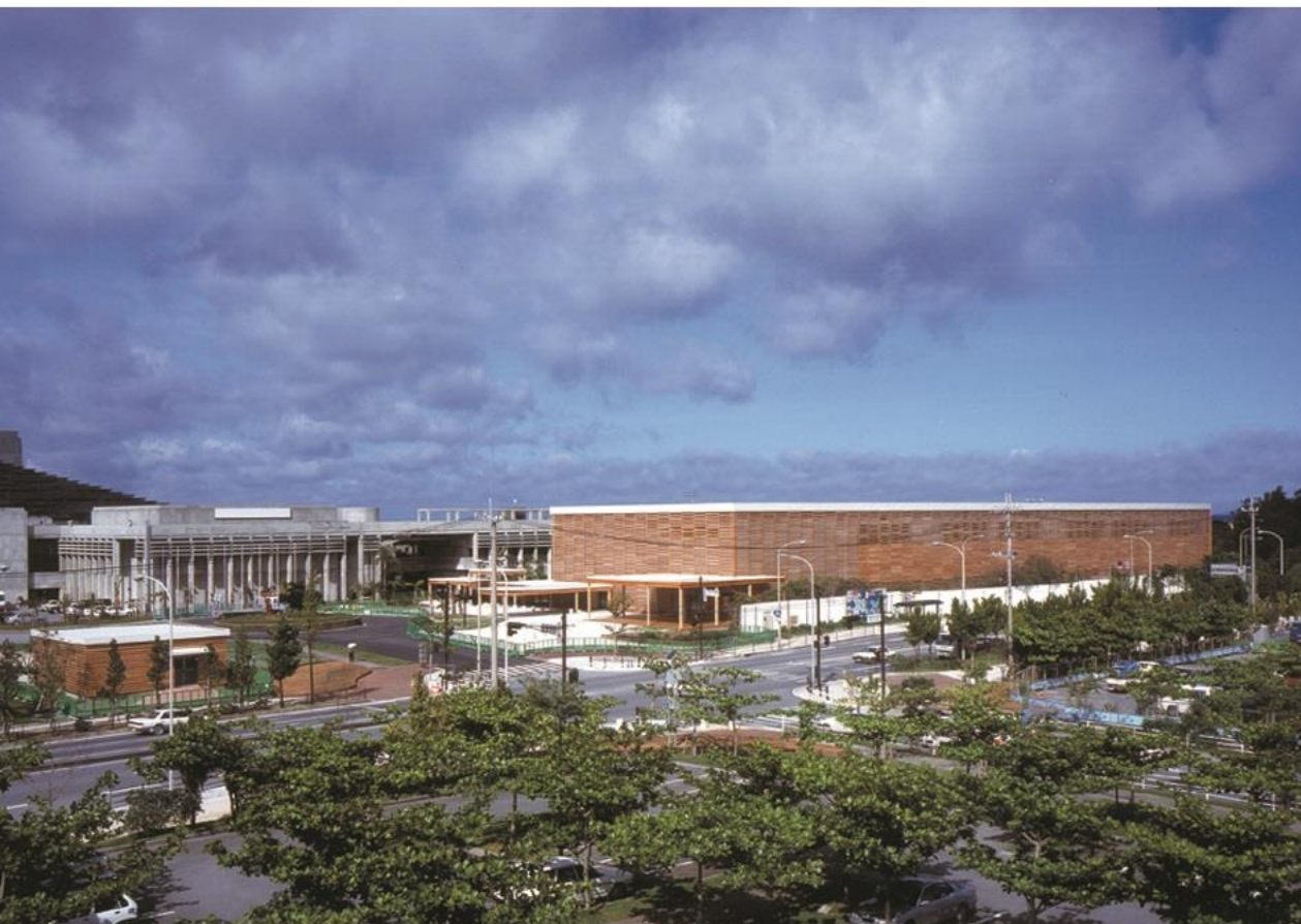
プレスセンターを市役所より望む