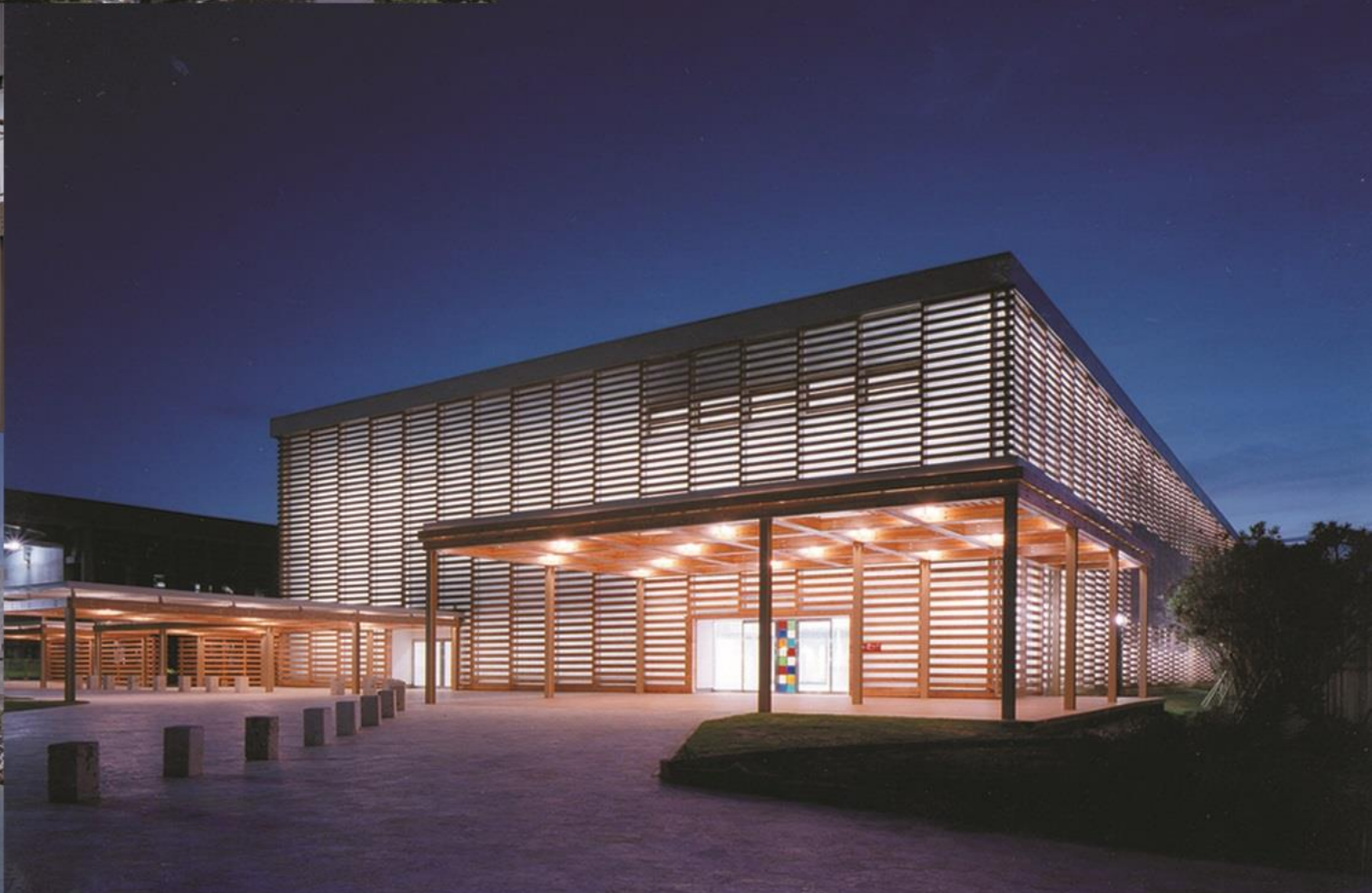
プレスセンターの夜景