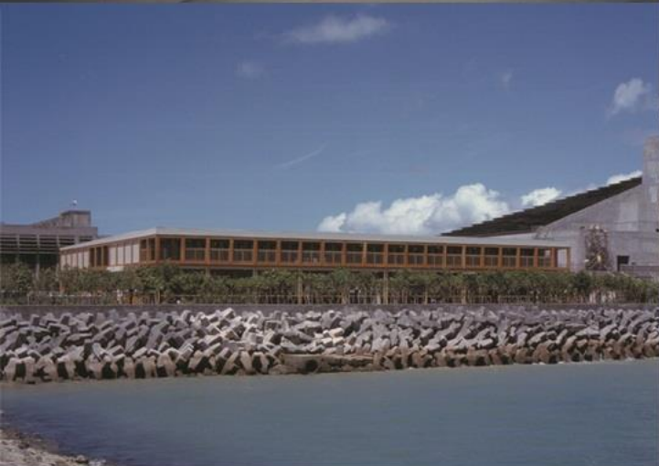
(下段) アメニティーセンターを海側から望む