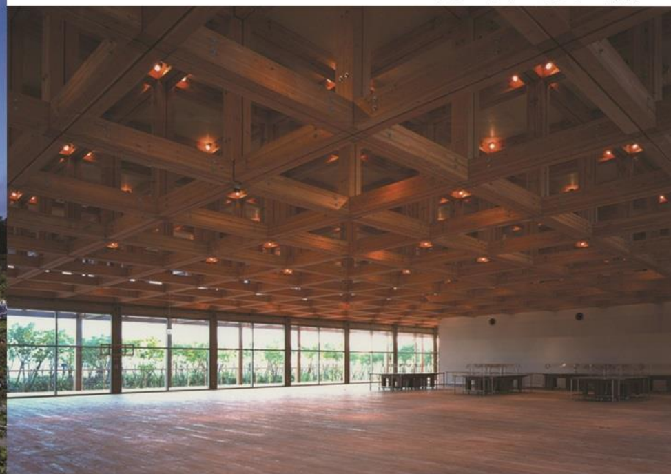
アメニティーセンター内観