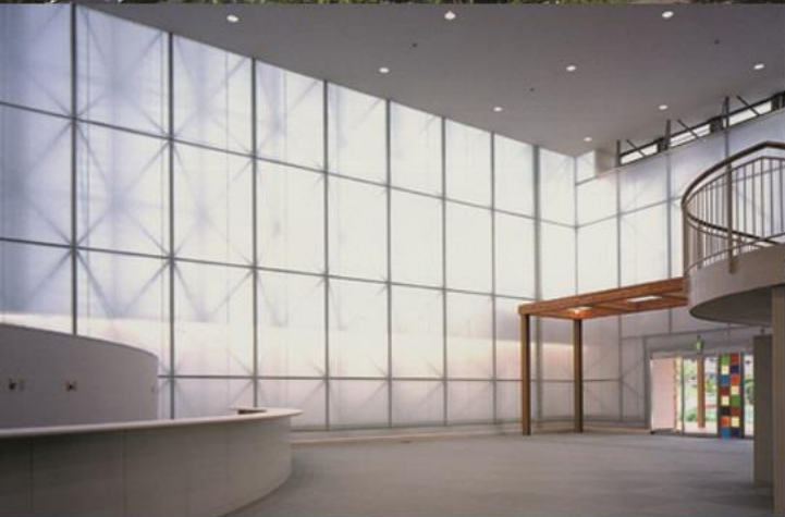
(中段) プレスセンター内観