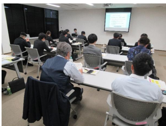
【新規採用職員等研修】

・令和7年9月30日に南部水道企業団に対し、コンプライアンスに関する出前講座を実施した（参加者20名）。