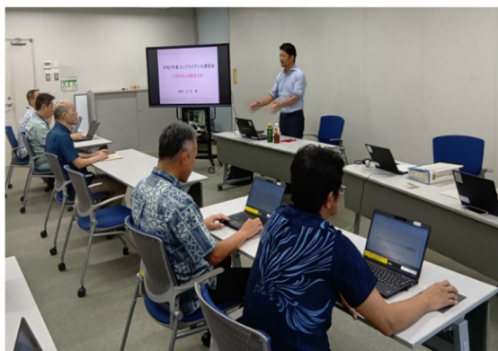
【コンプライアンス講習会】

認定されたインストラクターは、各事務所等におけるコンプライアンス・ミーティングで進行役を務めるなど、積極的に活用している。