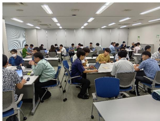
【コンプライアンス係長・係員研修】