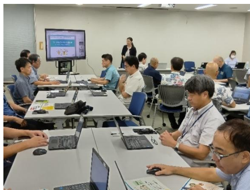
【ワークライフバランス講習会】