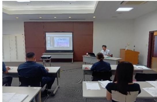
【コンプライアンスに関する出前講座】