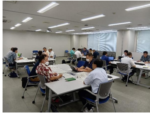
【コンプライアンス・インストラクター養成研修】