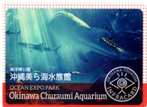
沖縄美ら海水族館

さて、3月26日（木）より沖縄美ら海水族館および首里城公園の『沖縄観光インフラカード』の配布を開始しますので、お知らせ致します。