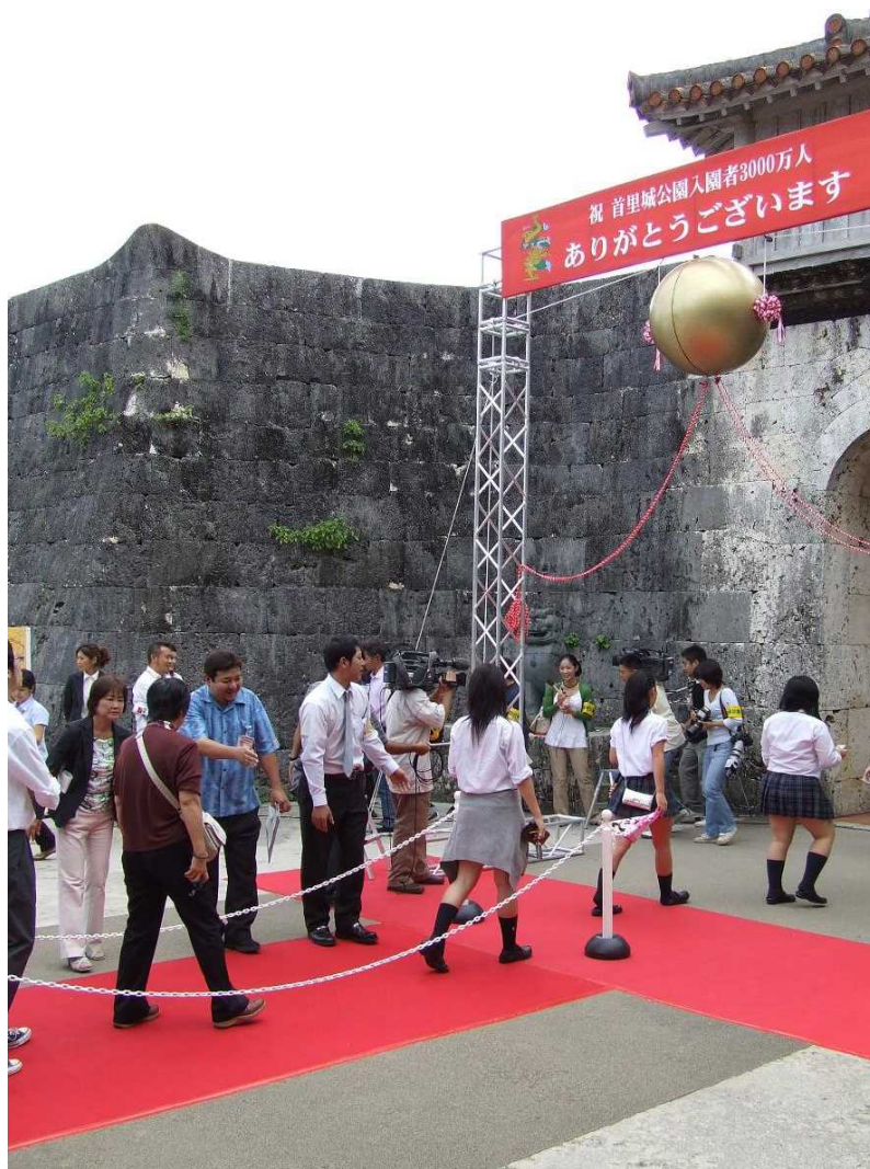
達成者確定の様子