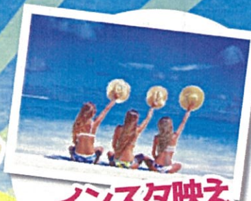
インスタ映え コンテスト