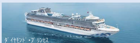
ダイヤモンド・プリンセス

【あて先/お問い合わせ】 〒900-0013 那覇市牧志3-2-10 3F 那覇市観光協会内「海と港の魅力発見ツアー第1弾」事務局あて TEL:098-862-1442(平日9時~17時)