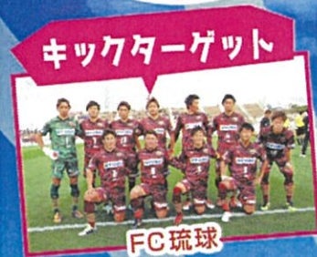
キックターゲット