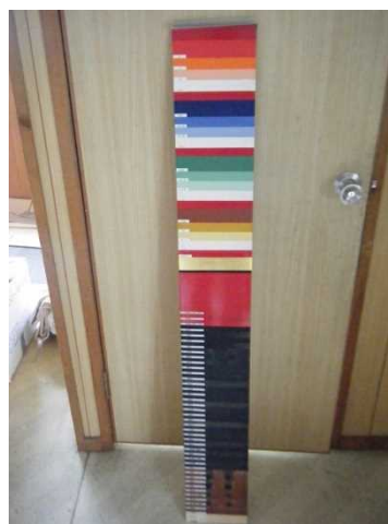
工程手板による彩色塗装工程の説明