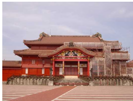
② 正面（右側部分）イメージ