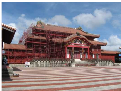
① 正面（左側部分）イメージ