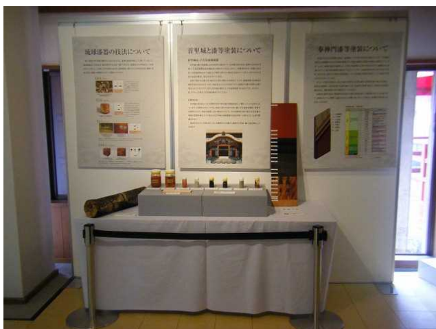
説明展示イメージ

漆塗装改修等作業に関する説明展示（各工程の解説版パネルや工程手板、原材料等）を実施します。