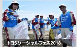
トヨタソーシャルフェス2018