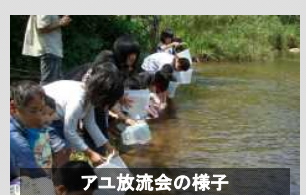
アユ放流会の様子