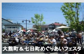
大熊町 & 七日町めぐりあいフェスタ