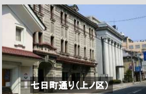
七日町通り(上ノ区)