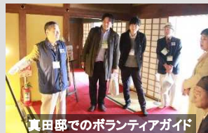
真田邸でのボランティアガイド