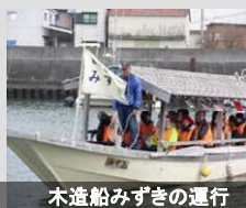
木造船みずぎの運行