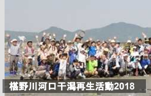
樫野川河口干潟再生活動2018