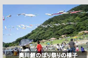
奥川鯉のぼり祭りの様子