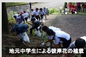
地元中学生による彼岸花の植栽