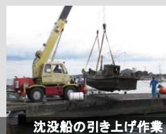
沈没船の引き上げ作業