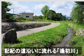
記紀の道沿いに流れる「逢初川」