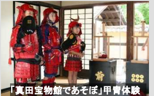
「真田宝物館であそぼ」甲冑体験