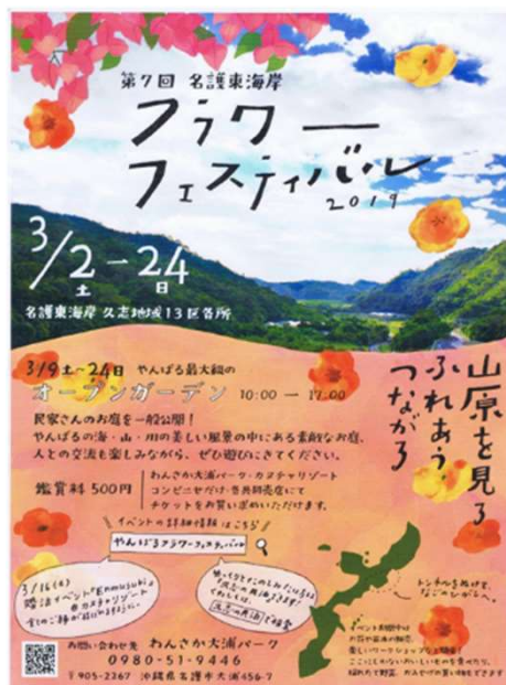
▲フラワーフェスティバルのポスター