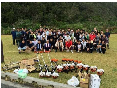
▲ボランティアによる道路美化活動

平成24年から、毎年2～3回の道路美化活動(約100人参加)やイベント開催[二見情話大会(8回開催、約400人来場)、フラワーフェスティバル(7回開催、約4,000人来場)]、平成27年から、毎年2回、河川自然体験学習(約40人参加)を実施しており、美化活動やイベント開催等を通じて、住民の意識や連携が高まっております。こうした背景から、地域活性化、観光振興、景観の向上につなげています。