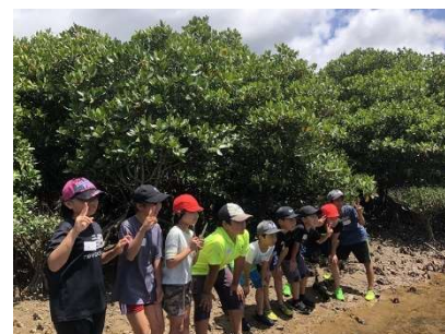
▲自然体験学習の様子