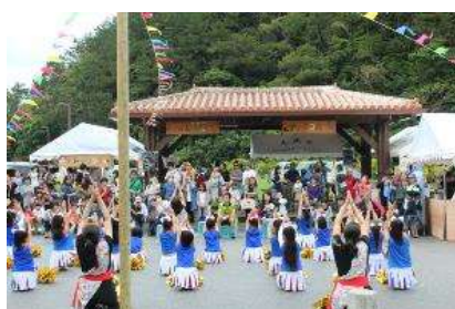
▲フラワーフェスティバルのイベントの様子