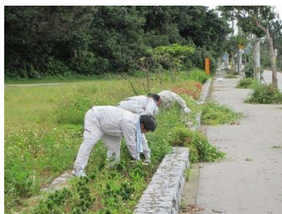
▲国道沿いの除草活動