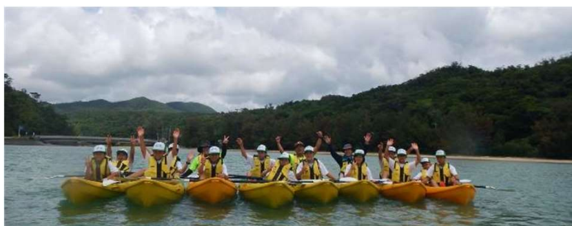
▲大浦川やマングローブ林を散策後のカヤック体験