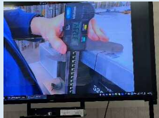
【寸法の数値化（デジタルノギス）】