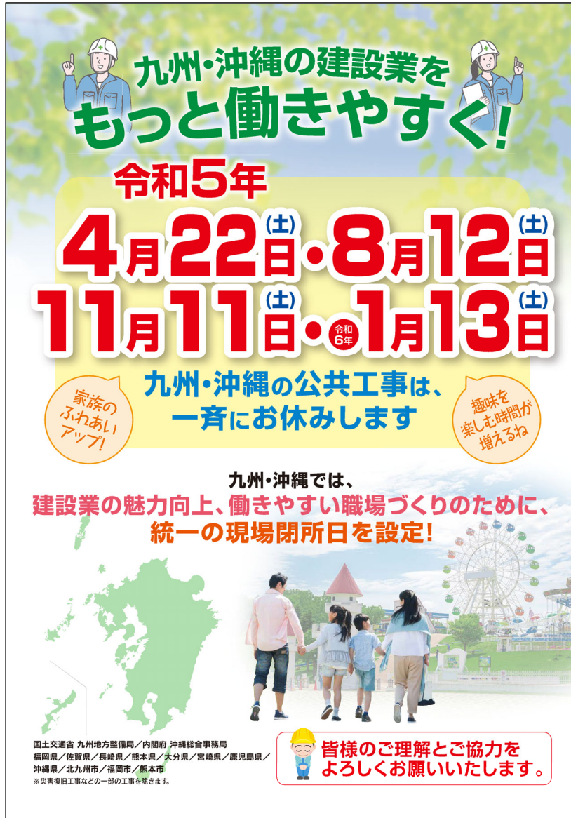
【令和5年度の九州・沖縄ブロック統一ポスター】