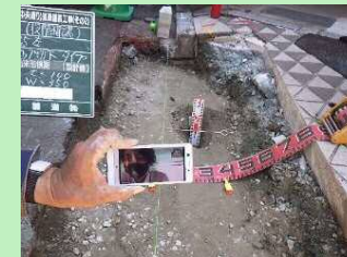
【使い慣れた機器を使用】