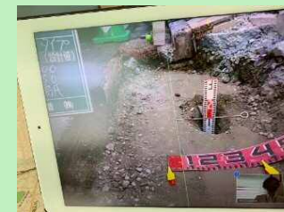
【スクリーンショットで現場状況を記録】