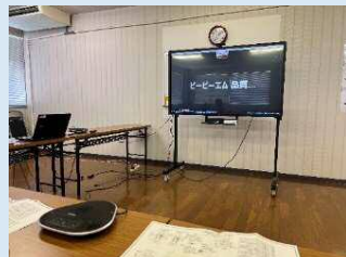
【大型モニター・マイクスピーカーの利用】