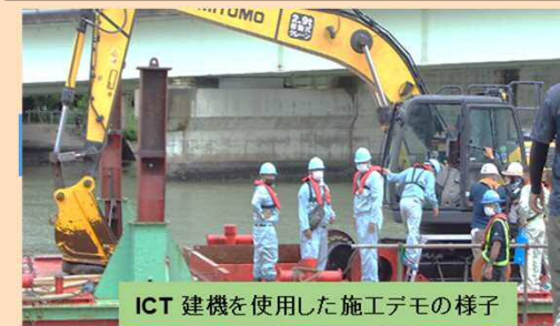
ICT 建機を使用した施工デモの様子