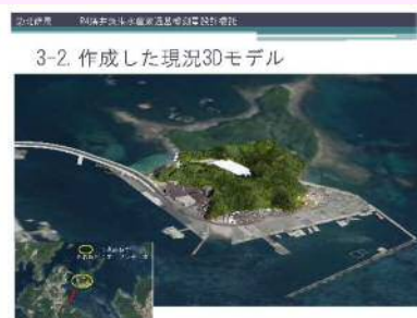
3-2. 作成した現況3Dモデル