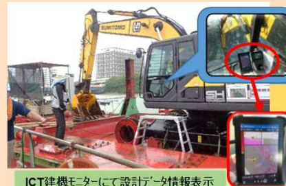
ICT建機モニターにて設計データ情報表示