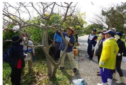
▲ サガリバナの取り木講習