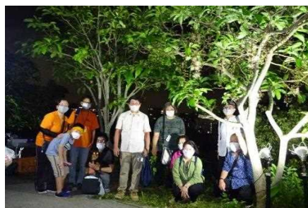
▲ サガリバナのライトアップ