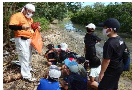
▲ 地元学生への環境学習(ゴミ調査)