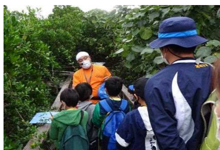
▲ 地元学生への環境学習 (観察)