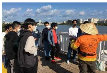
▲ 修学旅行生向け環境学習