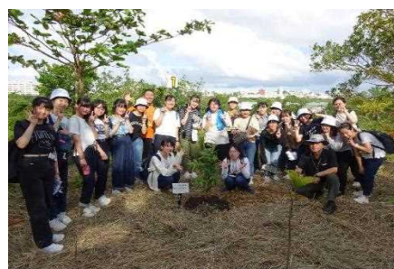
▲ サガリバナの植樹活動