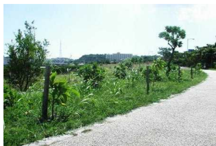
▲ 植樹を行ったサガリバナ

また、自然観察と河岸漂着物の観察/調査クリーンアップ、そして植栽活動を組み合わせた「楽しく、しっかり学ぶ」自然・環境の体験学習プログラムを開発し、地域の子供たちや修学旅行生などへの提供を行っております。