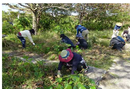
▲ 水辺緑化ボランティア活動