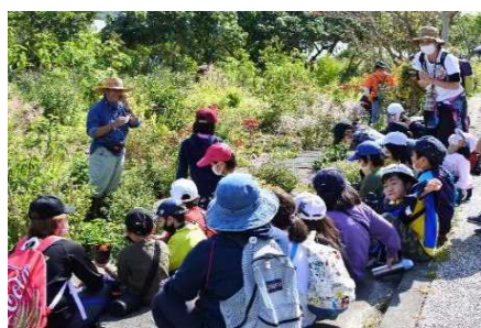
▲ 自然観察と組合せたボランティア活動