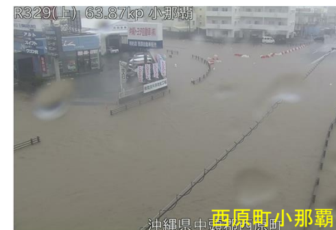
西原町小那覇 沖縄県中頭郡西原町