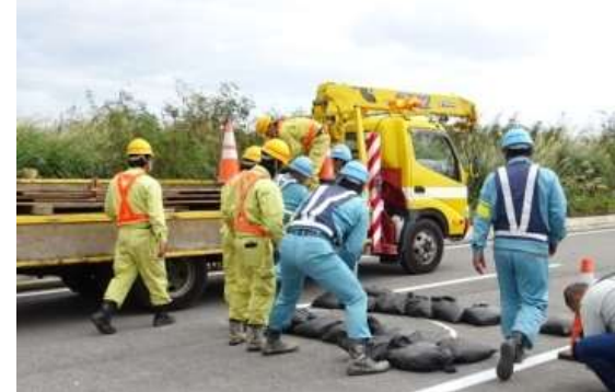
⑧橋梁段差への対応【土嚢工法】