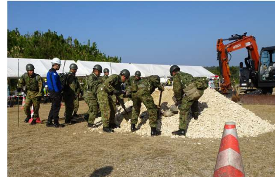
⑤負傷者の存在確認・がれきの除去