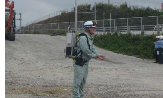
③被災情報の報告・情報共有