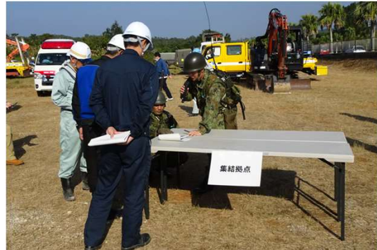
④集結拠点における道路啓開作業方針確認