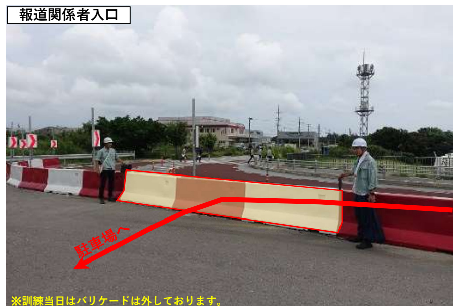
【訓練会場レイアウト】