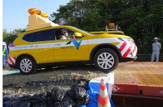
⑦橋梁段差への対応【ジオスロープ工法】