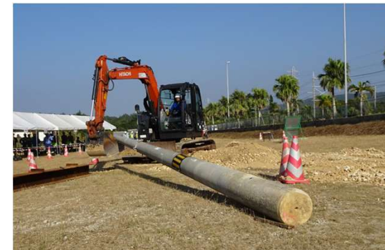
⑥電柱・電線への対応