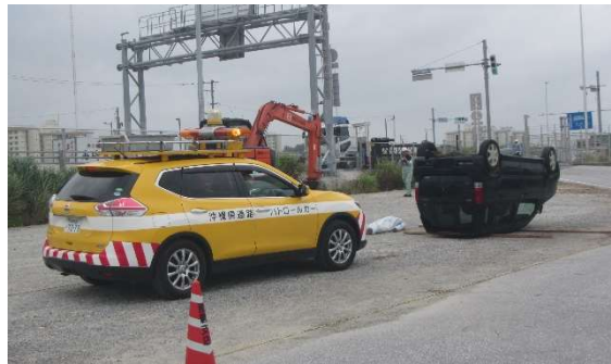
②道路パトロールによる被災情報の収集