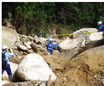
土砂災害被害状況の調査