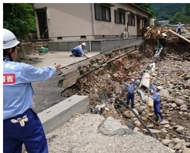
河川被害状況の調査