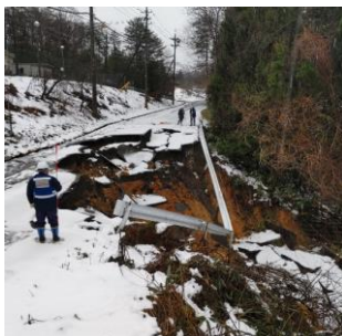
道路被害状況の調査