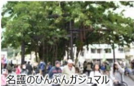
名護のひんぶんガジュマル