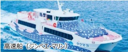
高速船（ジンバエ・マリン）