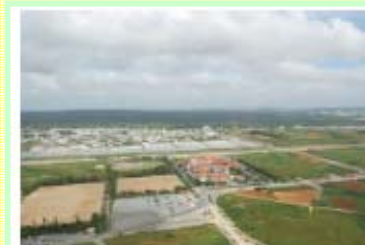
読谷役場、運動公園