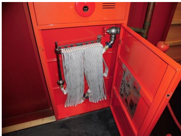
1号消火栓 <焼失前：正殿2階北側>