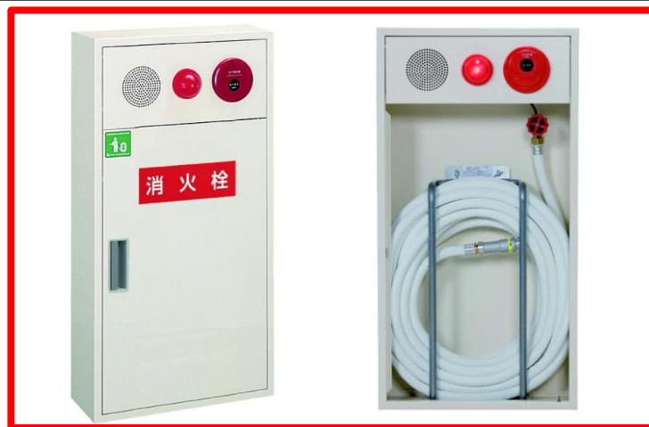
広範囲型2号消火栓 <今回検討>