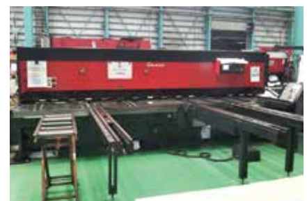
積極的な設備投資（2019年8月導入）

生産量が増加するなか、ボトルネックの解消や設備の負荷状況から積極的に設備投資を実施。業務の効率化、品質向上、生産の合理化に繋げている。また、従業員の長時間労働の解消にも寄与している。設備導入に合わせて生産ラインも見直したことで作業時間が短縮し、生産性の向上、受注量の拡大にも寄与している。進捗管理システムを導入したことで、工場内全体で作業が見える化できた結果、瞬時に作業内容の把握ができるようになった。