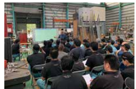
働き方改革をテーマに全社員参加の勉強会

受注量が増加する一方で、即戦力となる人員の採用は難しい。現状人員で作業効率化に取り組むため、昼食後に5分間ミーティングを行い早めに作業進捗を共有。部署横断的に作業の穴埋めを行うことで残業を削減し、一人あたりの作業を平準化することで会社全体で効率化させている。そのために生産管理システムを導入し製造プロセスの見える化に取り組んでいる。平成30年5月からは社長号令のもと、働き方改革を実施。ノー残業日、残業時間の上限などを設定してワークライフバランスの向上に努めている。