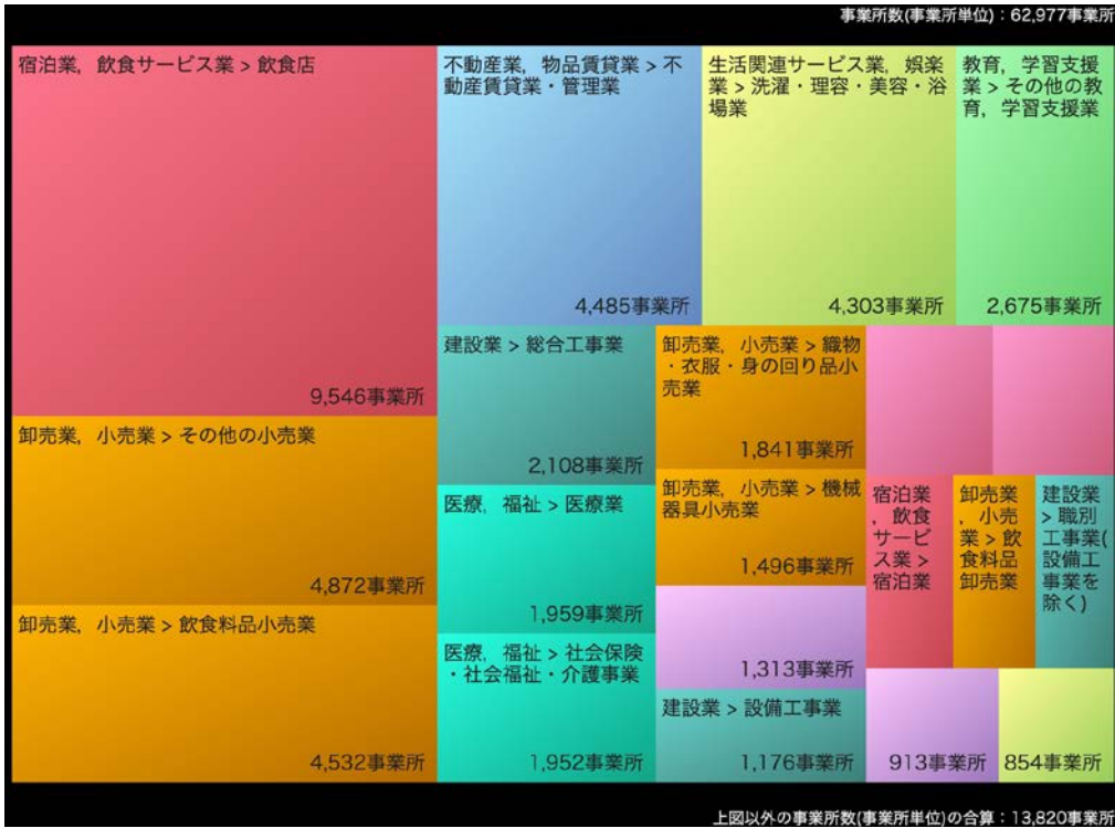
2012年 事業所数：62,977事業所