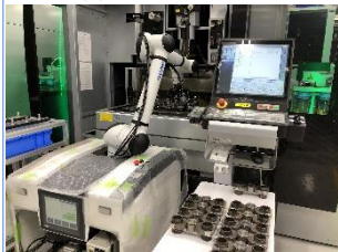
＜ワイヤー工程＞ ワーク交換