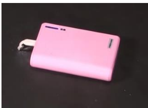
図 3 モバイルバッテリーのイメージ