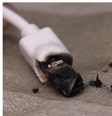
図 4 焼損した充電ケーブルのコネクターのイメージ