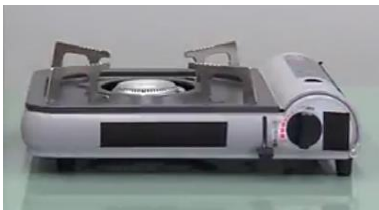
図2 カセットこんろのイメージ

カセットこんろの誤った使用は、ボンベの破裂による火災など重大な事故につながる可能性があります。以下の注意点に従って、安全にご利用ください。