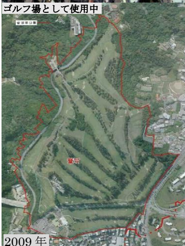
ゴルフ場として使用中