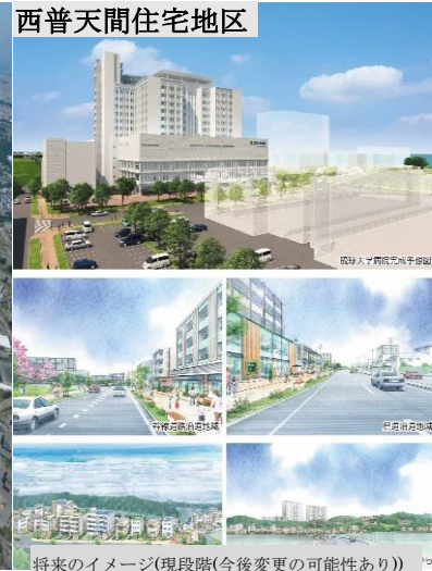
西普天間住宅地区