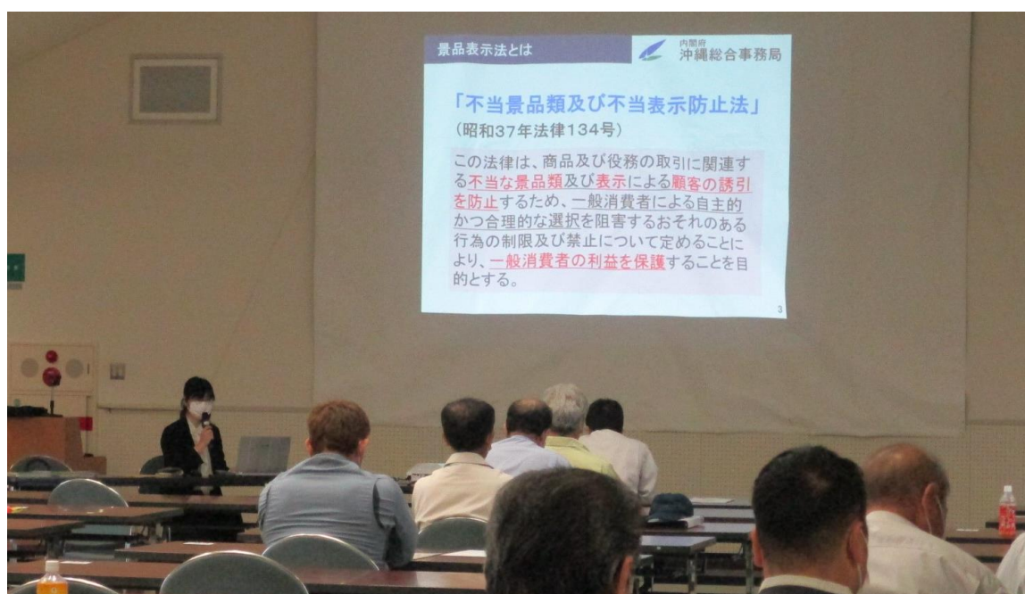
石垣市における講習会の様子