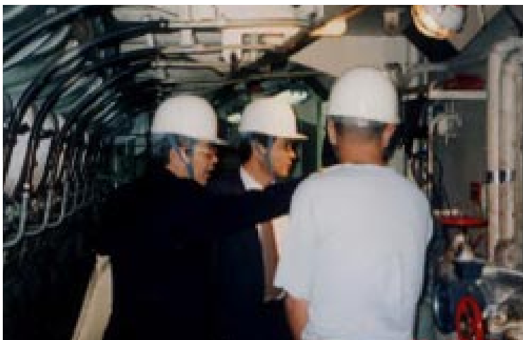
機関室内の安全標識をチェック。