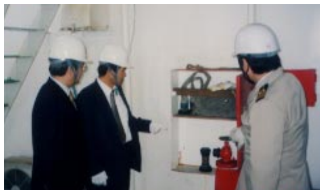
消化ホースの設置状況を確認。

労務官 OK！簡単に言つて、 船舶の航行の安全と船員の労働条 件の確保を図ること、船員の災 害防止を図ることが主な目的なんだ。 そしてその目的が達成できるよう に船舶所有者（雇用主）と船員に対 して指導・監督を行っているんだよ。 お姉さん 指導・監督って、ずいぶん 偉いのね。それでどんな方法でなさ るの？ 先任労務官 普段は、「通常船舶監 査」といって、直接船舶に向いて監 査していることが多いね。 労務官 通常監査の主な内容を説 明するとね、船舶の発航前にきち んと点検（検査）しているか、定期