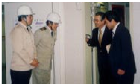
監査のため船舶に立ち入る船員労務官。