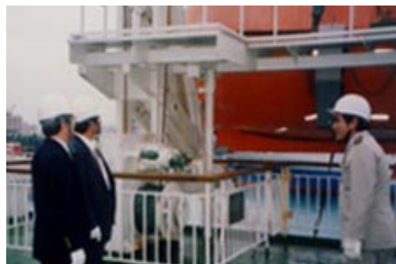
救命艇の設置状況を確認。