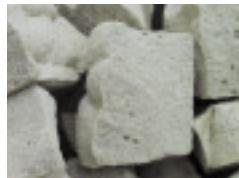
軽石に似た完成品