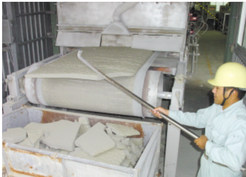
多孔質軽量資材の製造

具志頭村にあるガラスびんリサイクル施設では、自治体等が回収した空きびんを粉砕機でパウダー状にしたのち、焼成炉で加熱・溶融・冷却の工程を経て、軽石に似た多孔質軽量資材に再生します。再生品は、土木、建築、農業、緑化用として使用ができます。