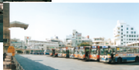
那覇バスターミナル