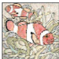
アートタイル (クマノミ)