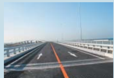
瀬長から豊崎方面を望む