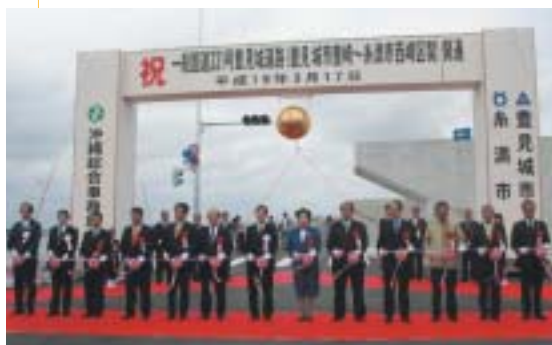
開通式テープカットの状況

開通後の効果！ 沖縄西海岸道路は、ハシゴ道路の一環として、読谷村から糸満市までを結び、延長約50kmの地域高規格道路です。国道58号、331号などの交通混雑を緩和し、空港・港湾などの広域交流拠点や地域開発拠点などの連絡を強化するとともに、地域振興プロジェクトと連携します。また、地域の混雑緩和への寄与はもとより、那覇空港へのアクセス向上による地域産業、観光及び地域振興を支援する道路であり、渋滞の解消や交通事故抑制、観光支援、地球温暖化対策、物流の効率化への効果が期待されます。