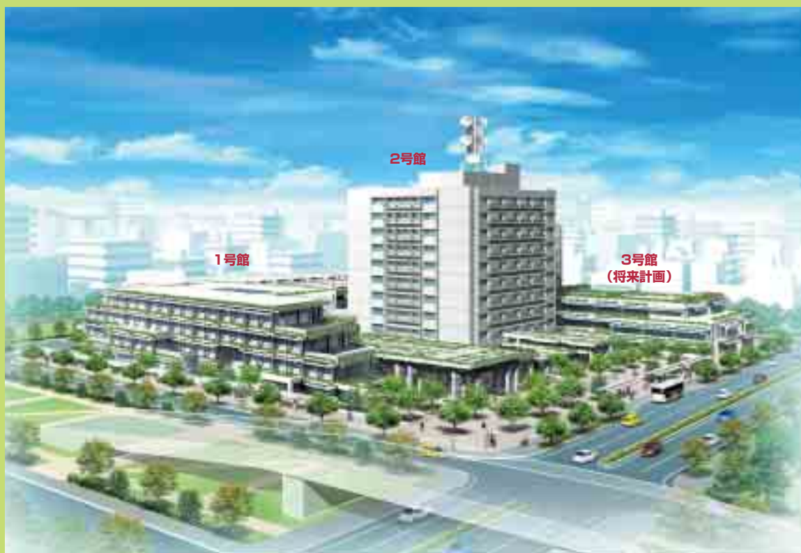
那覇第2地方合同庁舎完成予想図