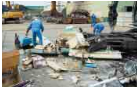
廃FRP船解体作業風景（H20.2.19）