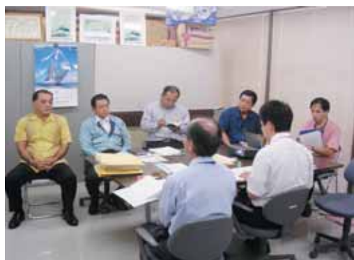
評価説明を受ける事業者