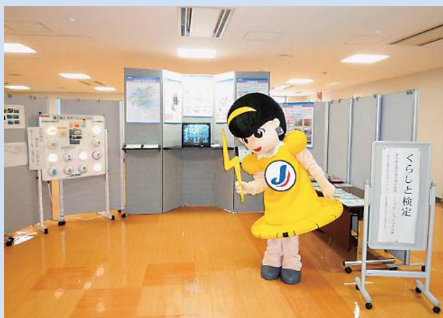
「電力量計及び電力量計負荷シュミレーション」展 (経済産業部)