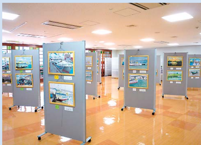
平成23年度「第48回全国中学生海の絵画コンクール」 沖縄地方展(運輸部)

「行政情報プラザ」における最新のイベント情報は、沖縄総合事務局ホームページから御確認いただけます。