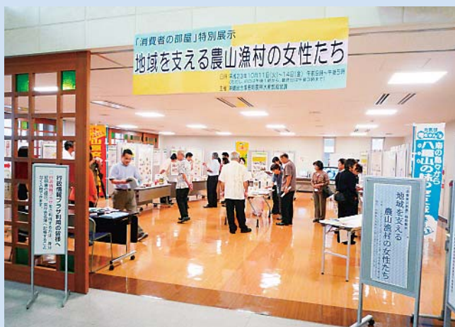
「地域を支える農山漁村の女性たち」 (農林水産部)