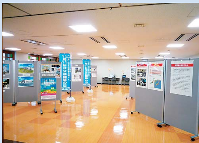
「土木の日」、「東日本大震災」合同パネル展 (開発建設部)