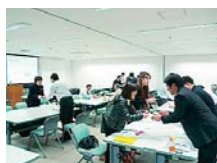
出展者同士で行った 模擬商談の様子

展示・商談会に出展を希望した県内事業者 27 社を対象に、事前準備プログラムとして、(1)「商品評価会」及び(2)「商談対策セミナー」を開催しました。 (1)「商品評価会」では、販路開拓したい商品について、ネーミング・パッケージ等について海外マーケットや輸出環境に合っているかどうかを評価・アドバイスを行いました。 (2)「商談対策セミナー」では、商談技術を向上させるための模擬商談の実施等を行いました。