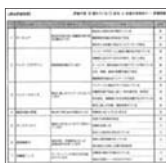
商品評価シート 抜粋