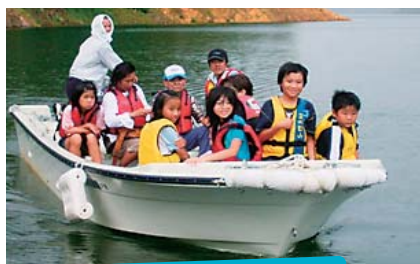
遊覧船でダム湖上流へ！