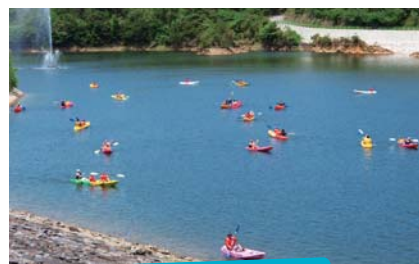
ダム湖でカヌー体験