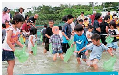
ウナギつかみ取り。子供達もオオハシャギ