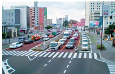
国道58号渋滞状況（泊交差点）