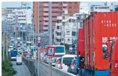
臨港道路渋滞状況（泊大橋）