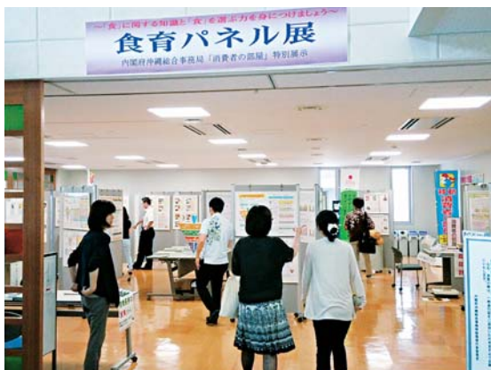
6月2日(月)～6日(金)に開催された「食育パネル展」

パネル展では、日頃の食生活を見直し、改善につなげるため、バランスの取れた1日の献立例などの展示のほか、BMIスケールによる肥満度測定コーナーなどを設けました。