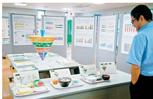
フードサンプルによる献立例や食事バランスガイド(模型)などの展示