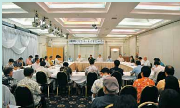
第I部 沖縄国際ハブクラスター推進会議

「金融機関のサポートに期待している」、「クラスターマネージャー、コーディネーターの支援を積極的に活用したい」、「海外の規制を含め仕向国の事情についてしっかり情報を持つことが重要」などのご意見もありました。