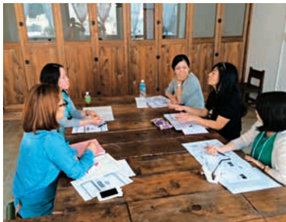
グループワークでビジネスプランを練り上げます