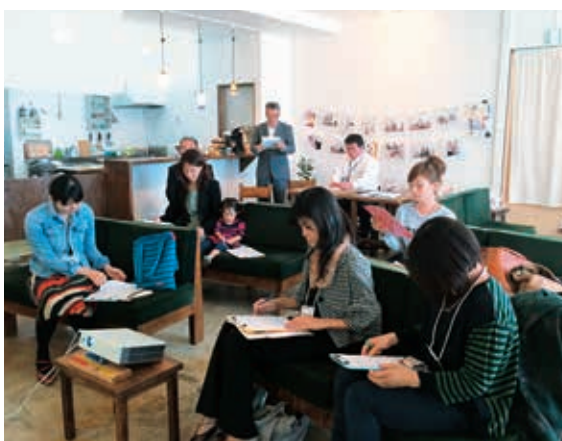
それぞれのステップに合わせた講義

様々な課題に直面し、乗り越えてきた県内外の女性起業家、多くのアーティスト・クリエイターをプロデュースしてきた方を講師として「これまでの活動と今後の展開」についてお話いただき、受講生6名の現状や課題について意見交換を行い、今後の展開についてのプランを練り込んでいきました。