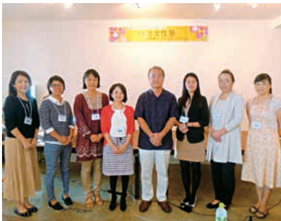
プレスタートコース受講生