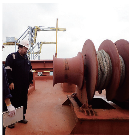
PSC実施中の様子(係船機)