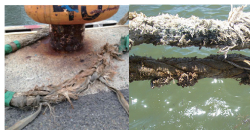
痛みが激しい係船索