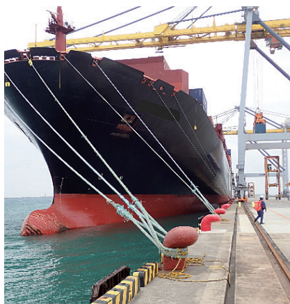
係船索で船を岸壁に固定