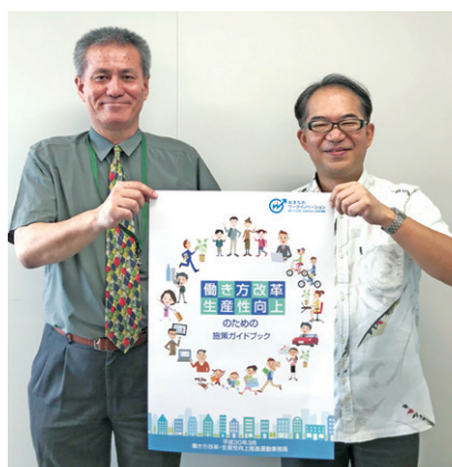
働き方改革・生産性向上のための「施策ガイドブック」

人手不足に課題を抱える企業にとって、人材の定着・確保や事業の効率化・省力化などの働き方改革や生産性向上に取り組むことは重要です。「働き方改革・生産性向上推進運動」を通じて県内中小企業・小規模事業者の皆様に取り組みを進めていただくために、このたび国や県、支援機関等が有する様々な支援策を一冊にまとめた