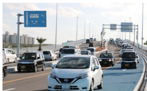
▲開通後の状況(臨港道路浦添線)