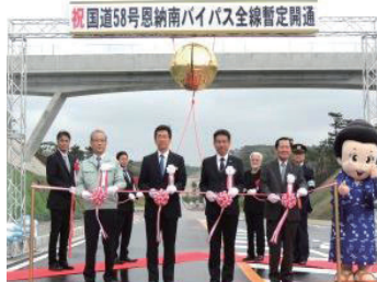
▲テープカット及びくす玉開披