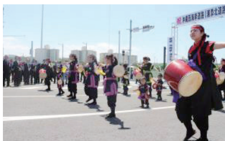
▲港川自治会の子供たちによる演舞