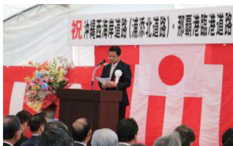
▲福井沖縄担当大臣による式辞