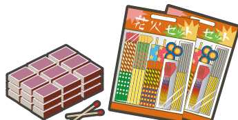
大量のマッチ・大量の花火 Large quantities of matches and fireworks