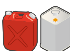
可燃性液体 Flammable liquids