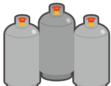
高压ガス High-pressure gas cylinders