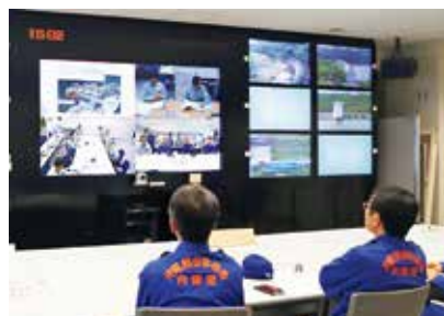
TV会議にて応急復旧方法を報告