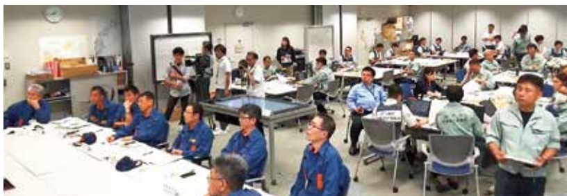
災害対策本部の様子