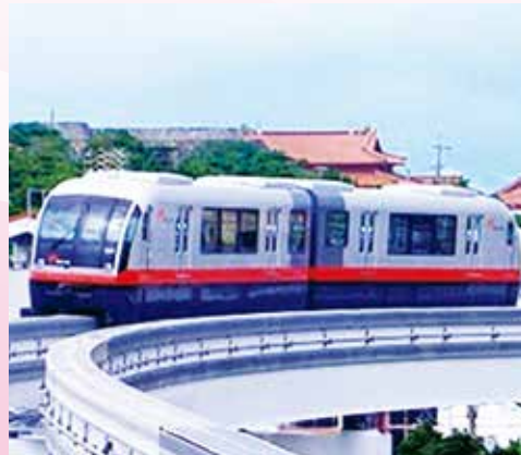
沖縄都市モノレールの整備