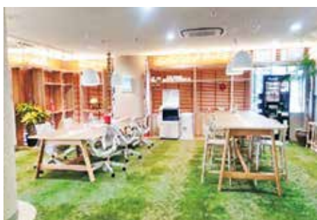
県内コワーキング施設の例

県外企業の沖縄進出や、県内企業等の働き方改革・企業価値向上に資するよう、既存施設の改修によるテレワーク施設の整備・活用を支援するため、三億円を計上しています。