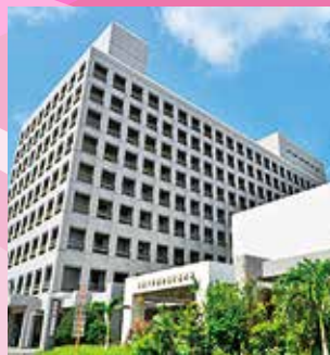
現在の琉球大学医学部及び 同附属病院

西普天間住宅地区跡地において、琉球大学医学部及び同附属病院の移設を核とした沖縄健康医療拠点の整備を推進するため八九億円を計上しています。