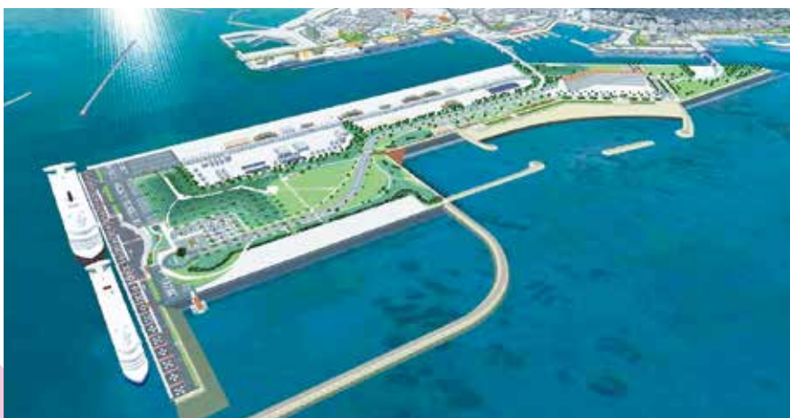
石垣港（新港地区）旅客船ターミナル