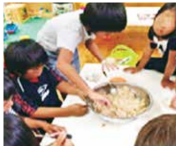
子供達に対する取組の様子

沖縄の将来を担う子供達が直面する深刻な貧困の状況に緊急に対応するため、支援員の配置や居場所づくりを集中的に行うため一四億円を計上しています。