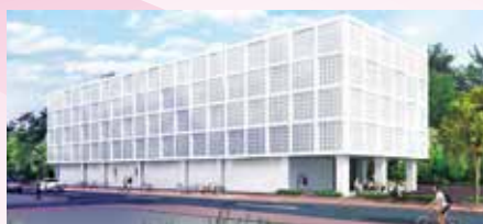
名護・やんばるの自然と 文化拠点施設整備事業(名護市) 完成イメージ

県土の均衡ある発展を図る観点から、北部地域の連携促進と自立的発展の条件整備として、産業振興や定住条件の整備等のため三五億円を計上しています。(公共分と合わせて六一億円)