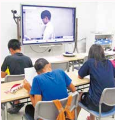
ICT を活用した町営塾（与那国町）

沖縄の実情に即してよりの確かつ効果的に施策を展開するため、沖縄振興に資する事業を県が自主的な選択に基づいて実施できる一括交付金として、一〇一四億円（ソフト交付金五二二億円・ハード交付金四九二億円）を計上しています。