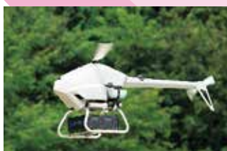
ドローンを活用した 物資輸送実証事業 (竹富町)

厳しい自然的・社会的条件に置かれている沖縄の離島市町村の先導的な事業を支援するため、一五億円を計上しています。