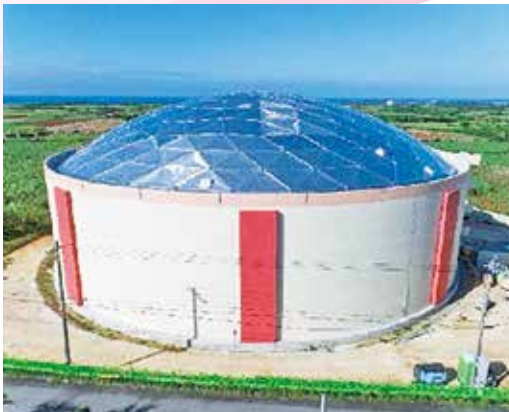
牧山ファームポンド（宮古伊良部）