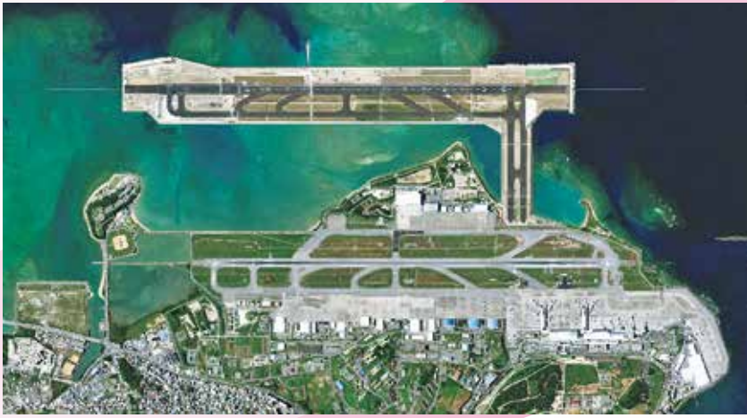
那覇空港 航空写真（令和元年 11 月）

また、那覇空港以外の離島空港も含めて、浸水対策などの防災・減災・安全対策、空港施設の老朽化対策を推進します。