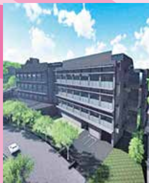
第5研究棟 (完成イメージ)

世界最高水準の教育・研究を行い、イノベーションの国際拠点となるため、新研究棟建設や新規教員採用など規模拡充に向けた取組を支援するとともに、OIST等を核としたイノベーション・エコシステム形成の推進を図るため、二〇三億円を計上しています。