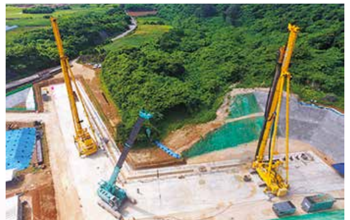
地下ダム止水壁の施工状況（宮古伊良部）