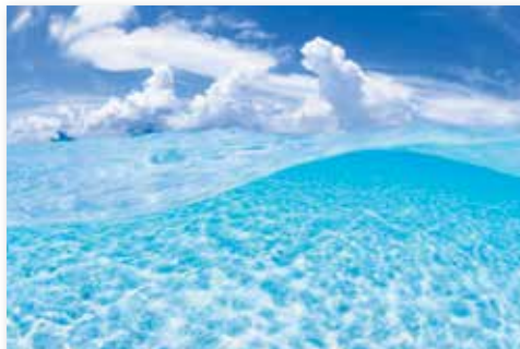
フォトコンテストシーズン4 最優秀作品 『夏のソーダ水』