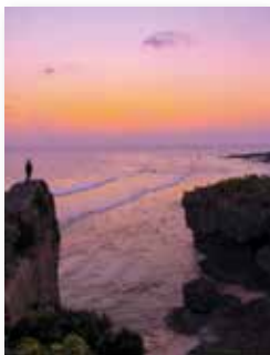
フォトコンテストシーズン4 優秀作品 『風を感じて～具志川城跡～』