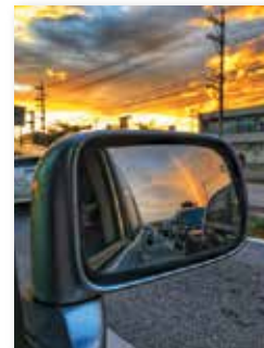
フォトコンテストシーズン4 優秀作品 『No rain, No rainbow』

内閣府が運営する沖縄の魅力を柔らかに発信するサイト「OKINAWA41」では、今年もフォトコンテストを開催します。シーズン5となる今回のテーマは、ずばり「 沖縄の魅力 」。皆さんの感性に基づいた写真をふるってご投稿ください。