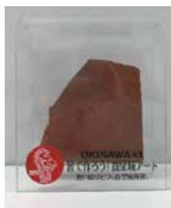
首里城の瓦のかけら (イメージ)