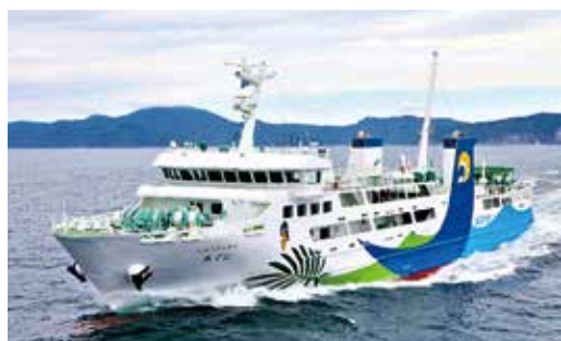
【過疎対策事業】 ニューフェリーあぐに建造事業