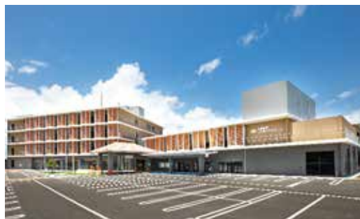
【公共事業等】 与那原町上の森かなちホール整備事業

地方公共団体が行う事業のうち、災害復旧事業、辺地・過疎対策事業のように国が責任を持つて対応すべき分野や、公共事業等のように国の政策と密接な関係のある分野に財政融資資金が活用されています。貸付残高は、昭和47年に旧琉球政府から引き継いだ際には205億円でしたが、令和4年3月末では6,895億円となっています。