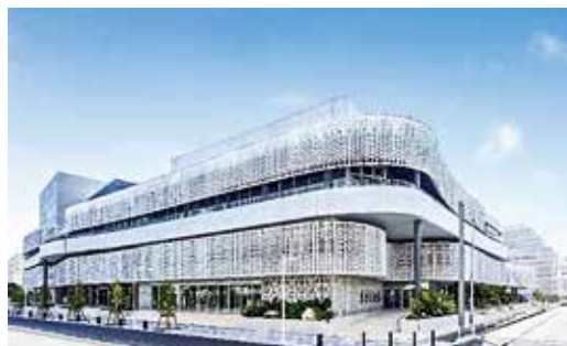
【一般補助施設整備等事業】 那覇文化芸術劇場なはーと整備事業