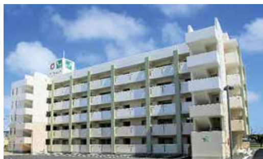
【公営住宅建設事業】 第一市営住宅整備事業(糸満市)