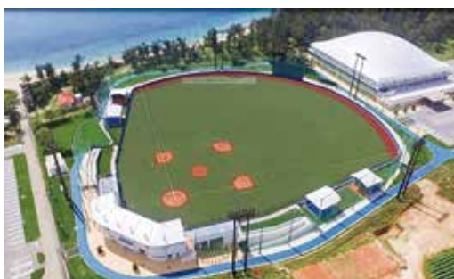
【辺地対策事業】 伊江村野球場整備事業