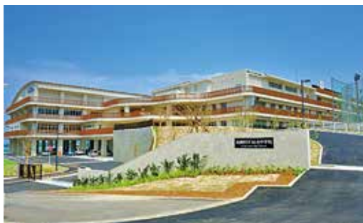
【学校教育施設等整備事業】 うんな中学校整備事業