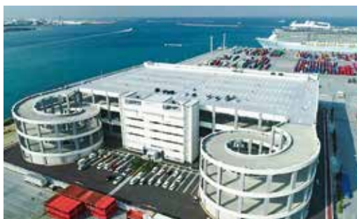
【一般補助施設整備等事業】 那覇港総合物流センター整備事業